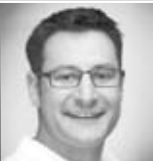
ZA F. B. Langenhagen