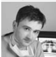
Oral-Ch. D. S. Chemnitz