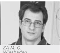
ZA M. C. Wiesbaden