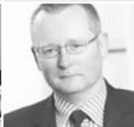
PAR Dr. C. K. Coesfeld