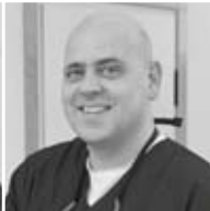
ZA S. H. München