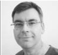
MKG Dr. Dr. B. L. München