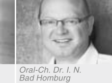
Oral-Ch. Dr. I. N. Bad Homburg