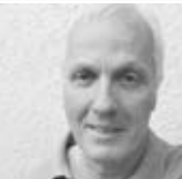
Oral-Ch. Dr. P. S. Wiesbaden