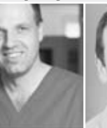
M.Sc. Dr. P. K. München