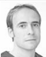
Oral-Ch. Dr. F. B. Stuttgart